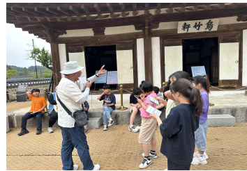
<오죽헌 해설 및 미션수행>