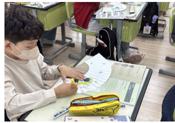
<초충도 부채 만들기 >