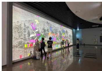
<화폐전시관, 미디어아트 전시관 관람>