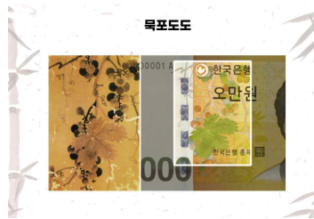
<화폐 속 성현과 자연 유산을 탐구하는 학습>